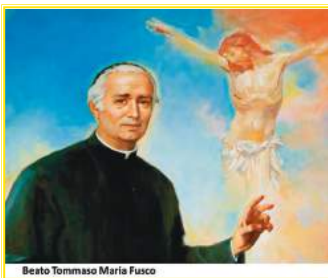
Beato Tommaso Maria Fusco

La sua grande fede , che sapeva trasmettere non solo con le parole, ma anche con l'esempio, spinto dalla passione apostolica propria del missionario, portava il popolo alla devozione. Durante la